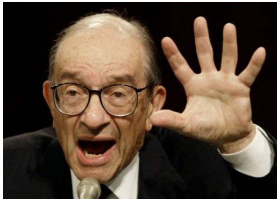
Sieht er etwas auf uns zukommen?

Auf diesen Umstand hat Alan Greenspan in seiner ersten großen Abschiedsrede vor der Finanzwelt hingewiesen. Er hat in Jackson Hole, Wyoming, wo die Elite der Zentralbanken sich jedes Jahr im Sommer versammelt, eine bemerkenswerte Rede gehalten: Zum Abschied nach 18 Jahren an der Spitze der US-Zentralbank gibt Greenspan den Anlegern zwei praktische Ratschläge: