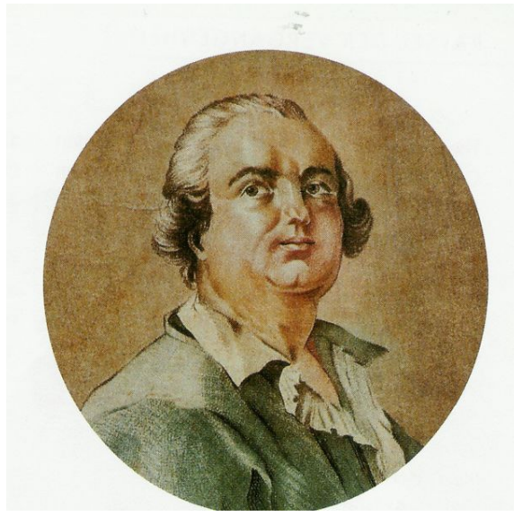
Alessandro Graf von Cagliostro - Scharlatan -

Kennzeichen der meisten Scharlatane. Von Malta zieht er nach Paris und London, wo er auf die örtlichen Bedürfnisse flexibel eingeht. Er verkauft Jugendelixiere, Schönheitsmixturen und Liebestränke. In London beeindruckt er zusätzlich als Gründer des ägyptischen Hochgrad-Freimaurer-Systems, des Memphis-Misraim-Ritus.