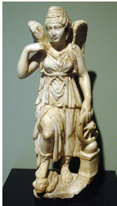
Nemesis, mit Schicksalsrad (in der linken Hand) und Bankier (unter dem rechten Fuß)

32-fachen Hebel ausgedacht. 3% Eigenkapital, 97% Fremdkapital. Dieser Fonds ist so konstruiert, dass er pleite geht, sobald die darin gehaltenen Wertpapiere um 3% fallen. Nun ist er pleite und man ist versucht, sich zu fragen, wie man im letzten Sommer sich eine solche Konstruktion ausdenken konnte.