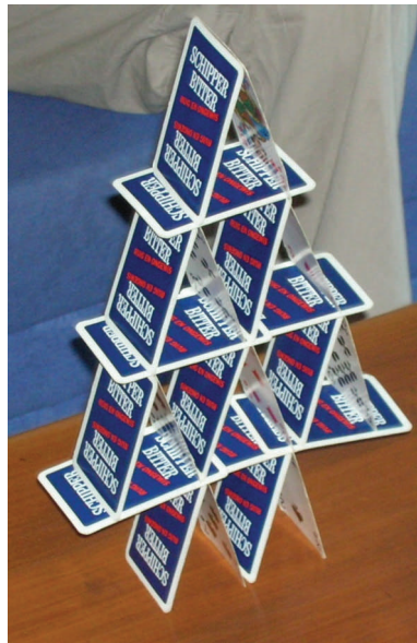
Die Karte unten links gehört der AIG

vollkommen und daher Gottes nicht würdig), ist immer wieder betont worden, dass das Wunder nicht als Verstoß gegen die Natur zu sehen ist, sondern lediglich gegen den uns bekannten Naturverlauf . 4 Kant greift diesen Gedanken auf und beantwortet die Frage, „was unter dem Worte Wunder zu verstehen sei ...“, dass sie Begebenheiten in der Welt sind, von deren Ursache uns die Wirkungsgesetze schlechterdings unbekannt sind und bleiben müssen.“ 5 Die Begegnung mit einem Wunder ist aber in der