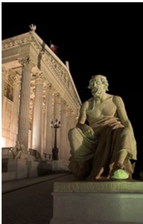
Thukydides vor einem börsenähnlichen Gebäude in Wien

Nun ist es eine der wesentlichen Vorsichtsregeln an der Börse, mit der Proklamation eines Paradigmenwechsels eher vorsichtig zu sein. Kreationen wie der Neue Markt sind schon vom Namen her suspekt. This time it's different gilt als der teuerste Satz an der Wall Street. Das hätte auch Thukydides bestätigt, wenn die Wall Street damals nicht noch ein Dschungel gewesen wäre (wir bitten, wie so häufig, den billigen Witz zu entschuldigen).