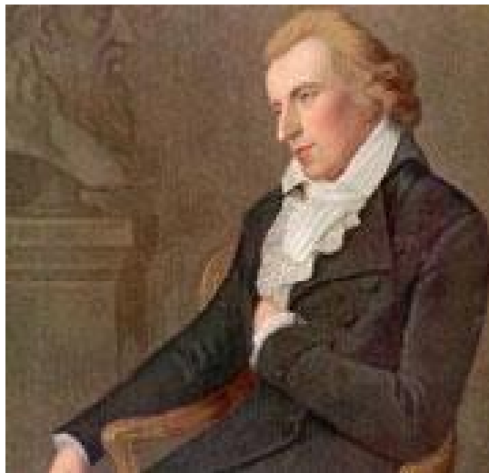
Schiller fühlt sein Herz

Nun sind in diesen unsicheren Tagen mit Recht aller Augen auf Griechenland gerichtet. Denn dort, wie erwähntes es im letzten Börsenblatt, wird in einer Art Trockenübung durchgespielt, wie Europa mit den viel schwierigeren Fällen in Spanien und Italien umgehen wird. Die Spanier sind heute dort, wo die Griechen vor vier Monaten waren, bei der Präsentation vollkommen unzureichender Sanierungsmaßnahmen für ihren Staatshaushalt. Die Italiener sind heute dort, wo die Spanier vor vier Monaten waren, bei der Erleichterung über das vermeintliche Überstehen der Krise.