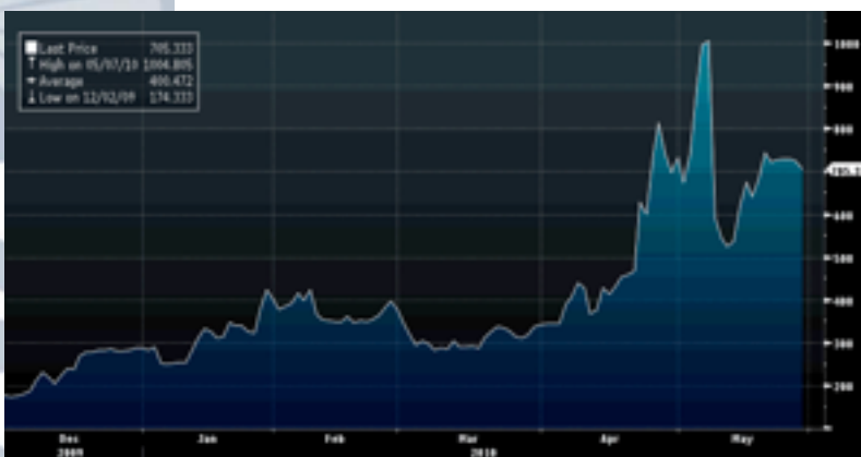
Credit-Default-Swaps Griechenland: Der Markt glaubt an den Haircut.