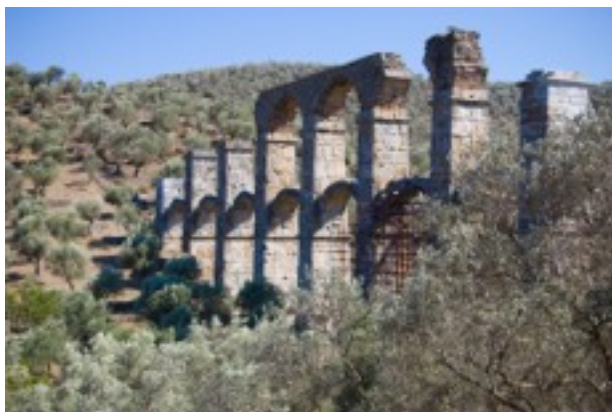
Von den Werken der griechischen Baumeister von Lesbos ist leider nichts stehen geblieben. Im Bild daher das römische Aquädukt.

Wie soll man mit neuen Situationen umgehen, für die sich keine passende Regel findet? Dieses Problem taucht in der Ethik immer wieder auf und stellt eine große Anforderung an die Urteilskraft des Einzelnen dar. Für den Umgang mit diesem Problem hat Aristoteles in seiner Nikomachischen Ethik die heute so genannte Lesbische Regel formuliert. Darin regelt er den Umgang mit dem immer wieder auftretenden Umstand, dass die allgemeinen Gesetze auf konkrete Situationen irgendwie nicht zutreffen. Aristoteles empfiehlt für solche Fälle, es mit den Baumeistern von der Insel Lesbos zu halten, die ein bleiernes Richtmaß verwenden, welches sich „der Gestalt des Steines angleicht und nicht dieselbe Länge behält“. 1 Wo die Umstände besonders sind, muss der Maßstab sich verändern, man kann nicht hoffen, dass sie sich ihm anpassen. Es ist besser, in einer konkreten Situation einen krummen, aber funktionierenden Maßstab zu haben, als