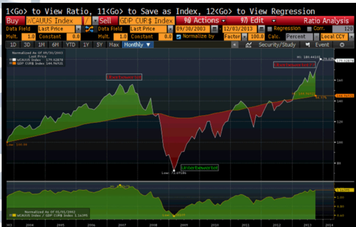
USA: Verhältnis von Aktienmarktbewertung zu Wirtschaftsleistung Die Kapitalisten haben wieder mehr vom Kuchen

Die Kurse werden derzeit also gestützt von den niedrigen Zinsen. Die Hausse ist keineswegs eine „Flucht in die Sachwerte“, angesichts einer bevorstehenden Inflation - sonst