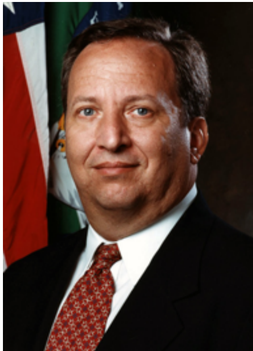
Lawrence Summers: Pas un esprit simpliste

gläubiger, das mutige Eigenkapital über das zittrige Fremdkapital. Sollen sie doch ihre ein- einhalb Prozent fressen, die Rentiers , so denkt sich der Aktionär und freut sich an den 20%, die er in diesem Jahr mit europäischen und amerikanischen Papieren verdienen konnte.