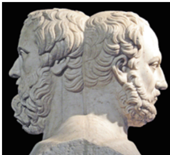
Thukydides (rechts) im Duell mit Herodot

Russlands Wirtschaft befindet sich schon länger in einer Krise. Jeder, der sich dort etwas Geld ergaunert hat, schafft es so schnell wie möglich ins Ausland. Im Jahr 2013 haben 63 Milliarden Dollar das Land