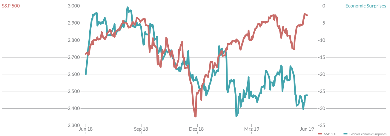
Tabelle 1: Wertentwicklung des S&P 500 12 Monate nach der ersten Zinssenkung