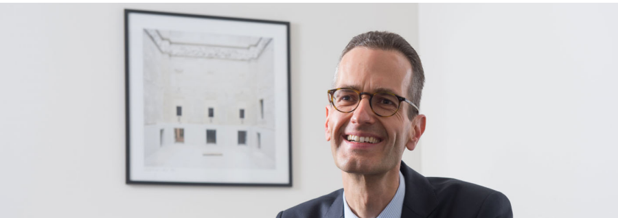
von Dr. Ernst Konrad

Seit Jahresbeginn befinden sich sowohl Anleihen wie auch Aktien in einer „Hausse-Stimmung“. Diese Koinzidenz gab es zwar in den letzten Jahrzehnten immer wieder (z.B. in den 1990er Jahren). Trotzdem hatten wir uns spätestens seit der Finanzkrise daran gewöhnt, dass steigende Aktienkurse eher mit fallenden Anleihekursen (sprich: höheren Renditen) einhergehen. Wenn dann auch noch die vorgebrachten Gründe für den jeweiligen Kursanstieg vermeintlich einander widersprechen, sollte der aufgeklärte Investor aufhorchen.