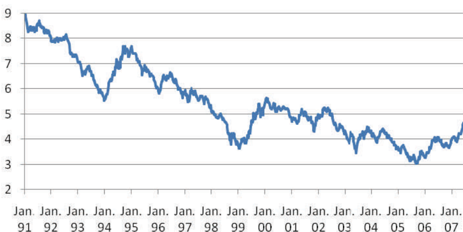
10-jähriger Zins Deutschland

Ausgelöst wurde das Problem aber nicht nur von der Immobilienspekulation und dem wenig verantwortungsvollen Umgang mit geliehenem Geld, sondern von einem Phänomen, das nur noch die Alten unter uns kennen: von steigenden Zinsen. Während die Kosten für Geld sich in den Jahren nach 2000 rapide dem Nullpunkt näherten, steigen sie nun bedenklich an – bedenklich für alle, die Schulden refinanzieren müssen. Ein Anstieg der Zinsen von 3% auf knapp 5% innerhalb von zwei Jahren