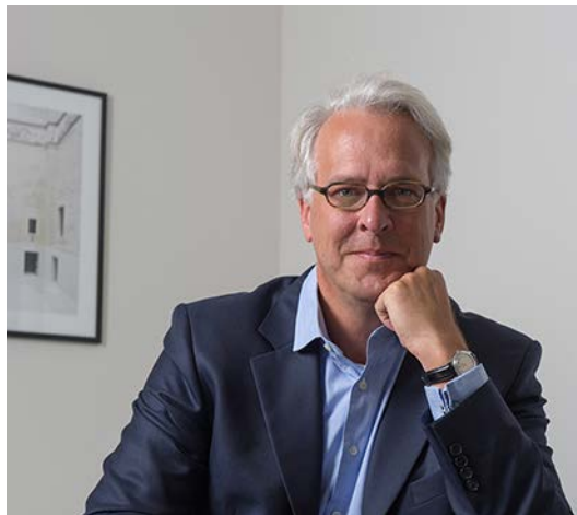
Dr. Georg Graf von Wallitz

Damit die Menschen auch wirklich gut schlafen können und nicht plötzlich auf die Idee kommen, durch gleichzeitiges Abheben einen Krach auszulösen, garantiert der Staat über die Einlagensicherungsfonds bis zu einer bestimmten Summe die Liquidität der Banken. Der Staat tut dies, da es für den Wirtschaftskreislauf von eminenter Bedeutung ist, dass die Banken die Unternehmen mit Geld versorgen. Sollten die Kundeneinlagen nicht reichen, können die Banken sich auch bei der Zentralbank refinanzieren, sodass eigentlich nichts passieren kann. Die Bankkunden bekommen immer ihr Geld wieder, egal wie dumm die Bankiers mit ihrem Geld umgehen. Ein Nebeneffekt der Staatsgarantie ist, dass Banken besonders wenig Zinsen zahlen müssen.