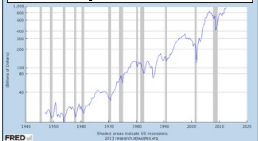
Unternehmensgewinne nach Steuern in den USA

in Aktien zu investieren. 1 Dagegen wird angeführt, dass die Gewinne heute historisch extrem hoch sind und immer dazu tendiert haben, früher oder später zu ihrem Mittelwert zurückzukehren. Und wenn die Gewinne wieder dahinschmelzen, dann ist die Bewertung der Aktien, die auf Dauer doch immer am Gewinn hängt, nicht mehr zu rechtfertigen. Außerdem ist die Konjunktur schleppend: Wie soll es da gelingen, außerordentliche Gewinne zu erwirtschaften?